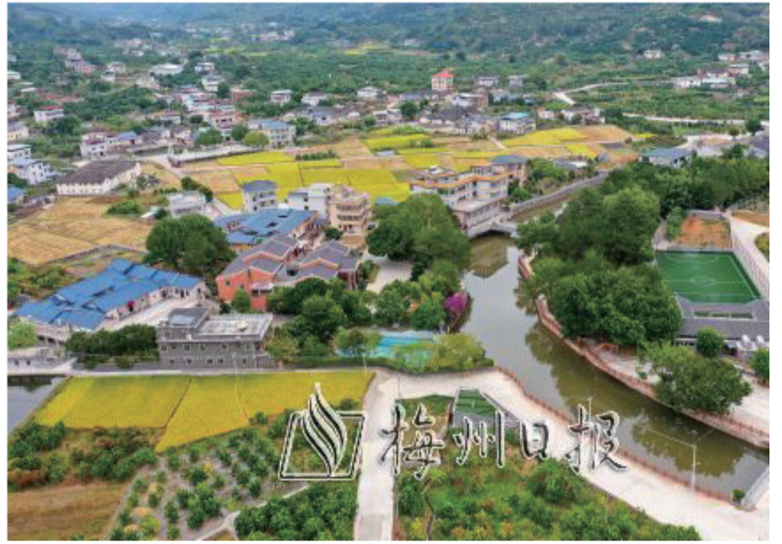
梅縣區隆文鎮岩前村實現美麗蝶變。

岩前村產業的發展還讓村民實現了就近就業，掙錢顧家兩不誤。“之前我祇是在家管理柚園，現在農閑時可以過來合作社務