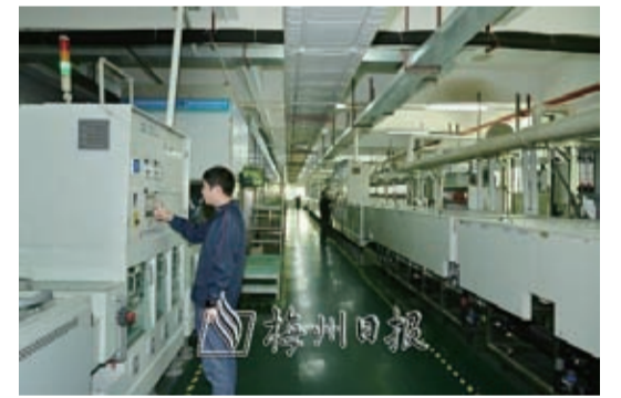
方寸電子科技有限公司生產車間一角。

接下來，梅江區將進一步明確目標任務，及時了解企業需求，把各項惠企政策落實到位，努力解決企業遇到的急難愁盼問題，積極為“小升規”重點培育企業和新“升規”企業在爭取資金、市場開拓等方面提供主動、貼心的服務，確保優質中小微企業及時“升規”入庫，助推已“升規”的企業穩中向好發展，努力實現全區經濟持續穩定增長。(張雲娜 鐘戈 鐘偉才 陳綺冰)